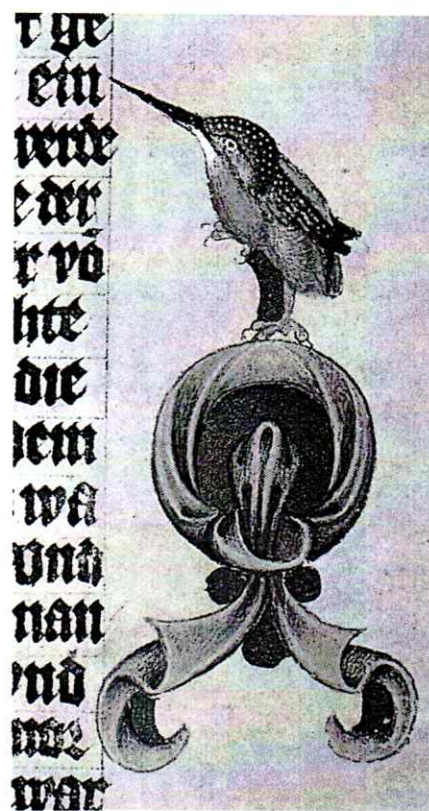
Oblíbené emblémy Václava IV. — točnice a ledňáček (německy psaná Bible Václava IV.).

pak připadlo králi Václavovi IV. Přestože se navenek v postavení Moravy zdánlivě nic neměnilo, mělo období neustálých vnitřních zápasů významný dopad na vnitřní správu. Zřetelně vzrostla moc šlechty. Několikrát došlo pod tlakem nejmocnějších rodů k uzavření dohod o zemském míru. Vznikl tzv. landfrýd , který se ze smluvního aktu postupně změnil v jakousi kolektivní autoritu reprezentující moravskou politickou obec.