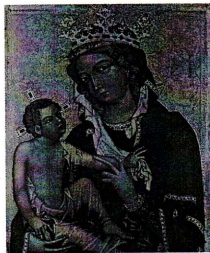
Madona z Vevří od Mistra Vyšebrodského oltáře (před r. 1350).