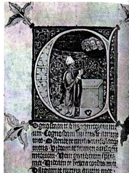
Arcibiskup Arnošt z Pardubic v iniciále „C“ z vlastní modlitební knížky.

Vévodství lucemburské bylo dědičnou zemí krále Jana. Zčásti bylo lenním územím francouzského krále, zčásti šlo o říšské léno. Karel IV. je věnil do soustavy zemí Koruny české, avšak již v následujícím století se začalo oddalovat, bylo prodáno vévodovi burgundskému a v 15. století připadlo jako dědictví Habsburkům. Další z konglomerátu zemí tvořících soustátí Karla IV. bylo markrabství braniborské. Karel IV. je přiřknul svému synu Zikmundovi a ten je světil Hohenzolernům, purkrabím norimberským, kteří si je udrželi trvale. Kromě toho patřila k zemím Koruny české nepřeledná řada drobných území v Bavorsku, Míšeňsku a v Horní Falci. Šlo často jen o jednotlivé hrady, městečka nebo vesnice, jen ojediněle o větší statky. Samotný přehled zemí Koruny české ukazuje, že šlo o zcela nesourodý útvar, jehož vnitřní stmelení se vymykalo možností jakékoli osobnosti té doby.