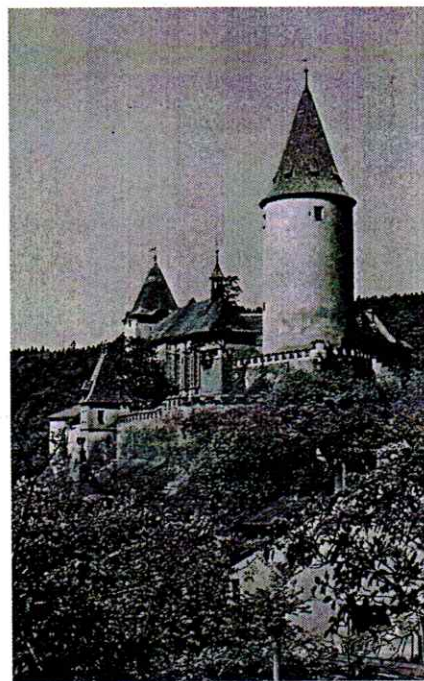
Hrad Křivoklát — jeden z několika hradů, jež zůstaly v době panování Jana Lucemburského ve vlastnictví koruny.

Neúspěšný byl pokus Jana Lucemburského o získání Tyrolska prostřednictvím sňatku svého syna Jana Jindřicha s dcerou Jindřicha Korutanského Markétou Maultasch. Vysloveným politickým dobrodružstvím byl pokus o proniknutí do severní a střední Itálie. Jen načas uznala jeho vládu řada tamějších signorií (Bergamo, Bobbio, Brescia, Como, Cremona, Mantova, Milán, Modena, Novarra, Pavia, Reggio, Verona), jako dědičné léno pro svého syna Václava (Karla IV.) získal Luccu. Panství Lucemburků se zde udrželo jen