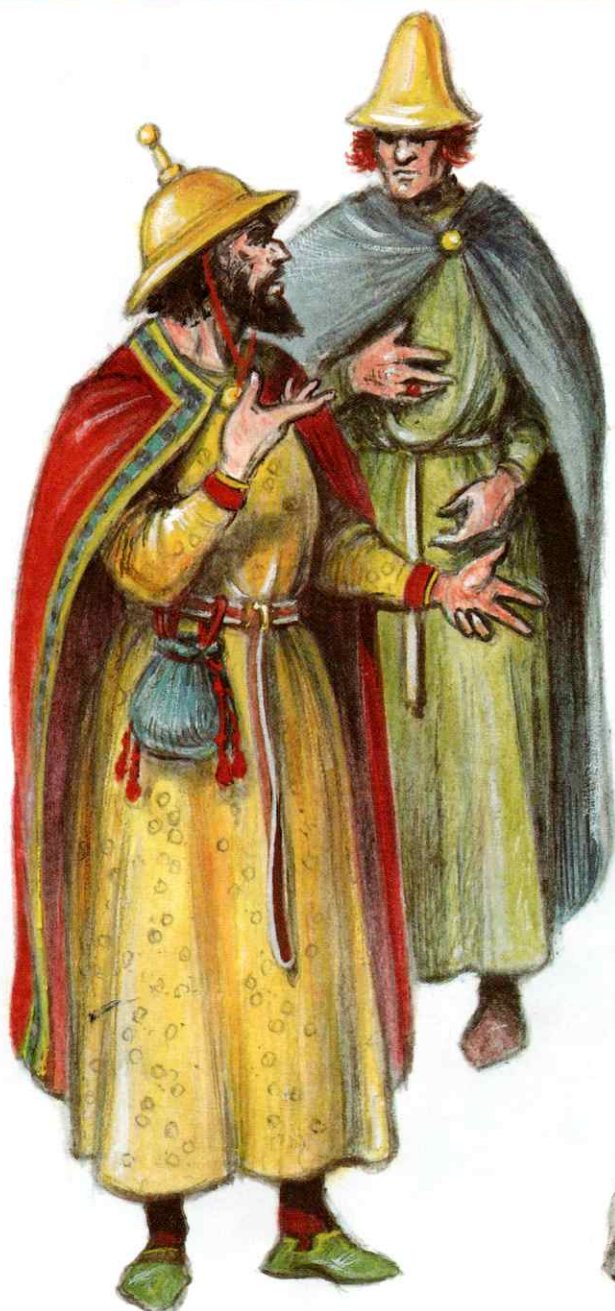
Židé se špičatými klobouky.

To způsobilo, že Židé vyhnaní již ve starověku ze své domoviny v Palestině žili nuceně odděleni od ostatního obyvatelstva. Často byli pronásledováni a docházelo k násilným útokům na židovské obyvatelstvo, k takzvaným pogromům.