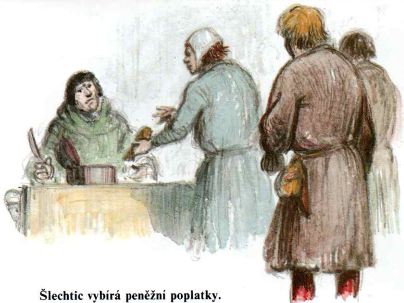
Šlechtic vybírá peněžní poplatky.

Ve 12. a 13. století byly zakládány nové vesnice v krajích, kde se dříve rozkládaly husté a neprostupné lesy.