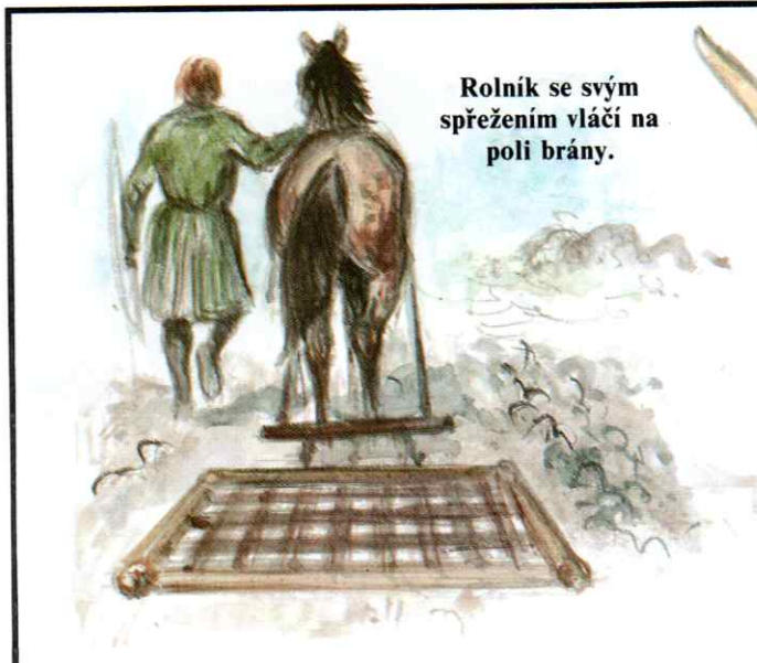
Rolník se svým spřežením vláčí na poli brány.