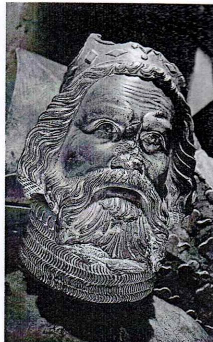
Detail náhrobku Přemysla Otakara II. Portrét nese rysy utrpení (Parléřova huť kolem 1375–1380).

„V určený tedy den bitvy se srazí šiky obou vojsk a podle toho, jak určuje rozličnost výsledků, nemálo bojujících z té i oné strany bijí se ostřím mečů. Chvěje se kopí a pole i lučiny mokvají krví, jedny tu vraždí a jiné zas chytají živé jak ptáky, většina po meči hyne; jak zloději mnozí však z Čechů hledali záchranu v útěku a hanebně opustili krále uprostřed nepřátel s hrstkou svých mužně bojujících. Ale protože odpor hrstky proti většině nemohl dlouho trvati, král v zápalu boje byl konečně zajat a proti důstojnosti říše po zajetí hned usmrčen.“